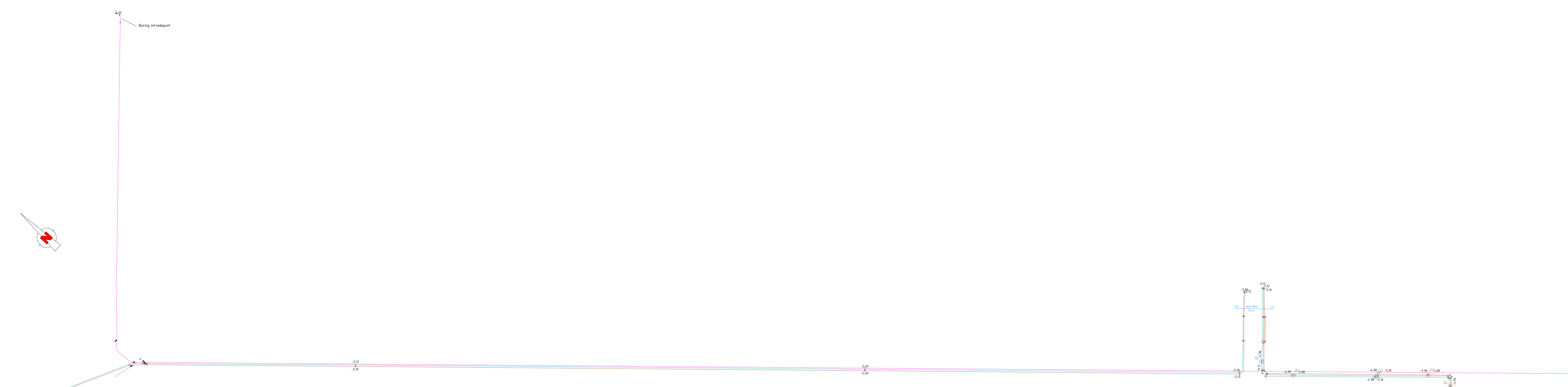
Aanzicht 2 Schaal 1 : 1000